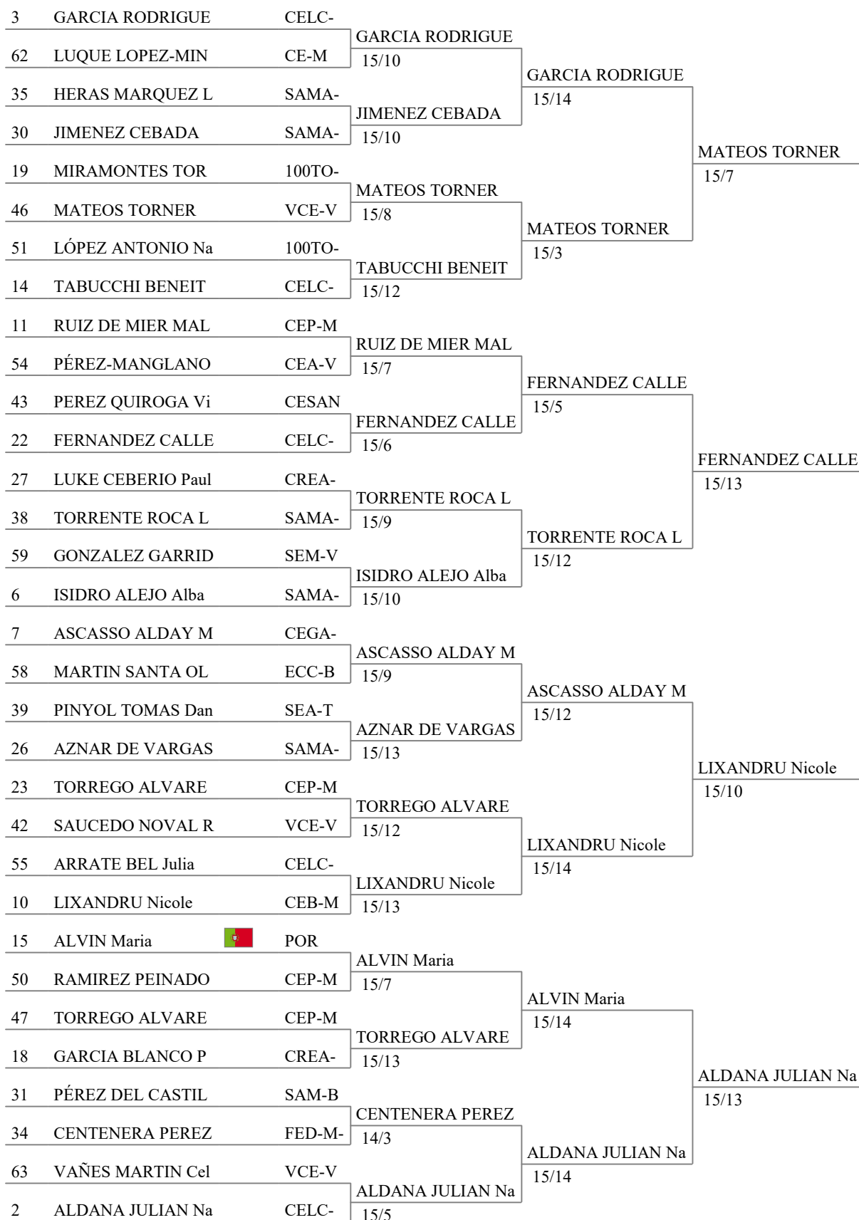
Tableau of 16